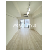
間取りの「S」はサービスルーム(納戸)です。